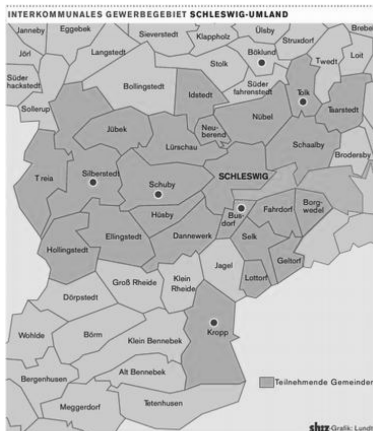
Interkommunales Gewerbegebiet Schleswig- Umland Schleswiger Nachrichten, 26.01.2012

Das Verbandsgebiet ist in nachstehender Grafik abgebildet.