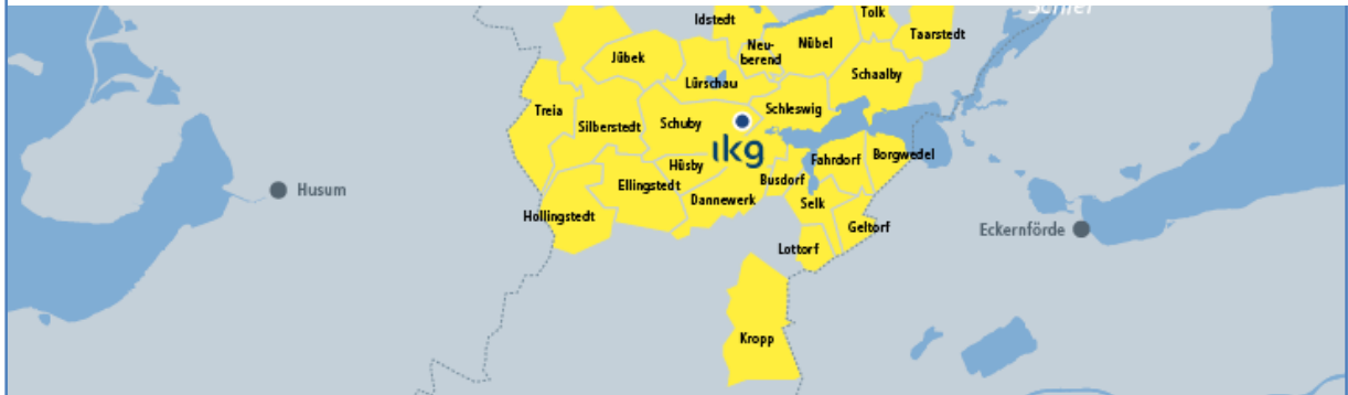
Zweckverband Interkommunales Gewerbegebiet Schleswig-Schuby

Die Verbandsmitglieder streben eine interkommunale Zusammenarbeit zur Ausweisung, Erschließung und Verkauf von Gewerbeflächen im Bereich des Interkommunalen Gewerbegebietes Schleswig-Schuby an. Hierbei sind die regionalplanerischen Zielsetzungen der Landesplanung zu beachten. Es wird ein ausgewogener Interessenausgleich zwischen den beteiligten Vertragspartnern angestrebt.